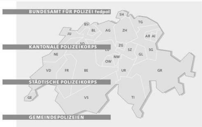
Мал. 1. Розподіл поліції Швейцарії за сферою дії

За сферою дії поліція Швейцарії розподілена на три частини: Федеральну службу поліції (Bundesamt für Polizei), поліцію кантонів (Kantonspolizei), поліцію міст і громад (Stadt- / Gemeindepolizeien).