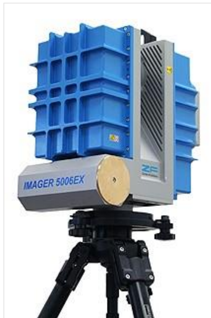
Мал. 3 Сканер Z+F IMAGER 5006

Цим вимогам відповідає лазерний сканер Z+F IMAGER 5006 (Німеччина) у складі з цифровою камерою RolleiMetric і лазерна скануюча система Faro Focus 3D 2 .