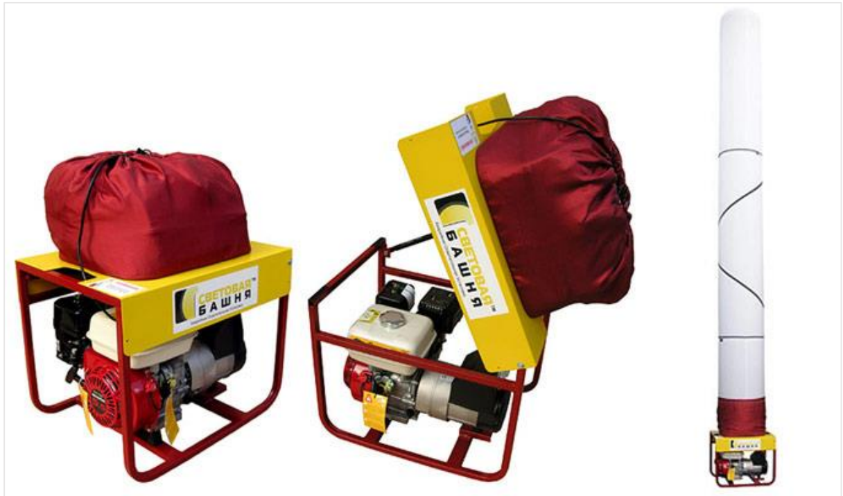
Мал. 2 «Світлова вежа»

освітлювальна установка «Світлова Вежа» освітлює територію більше 10 тисяч квадратних метрів. Світильник виготовлений зі спеціальної тканини, яка в згорнутому стані являє собою компактний тканинний контейнер, який надувається насосом і піднімається на висоту від трьох до семи метрів у вигляді циліндра.