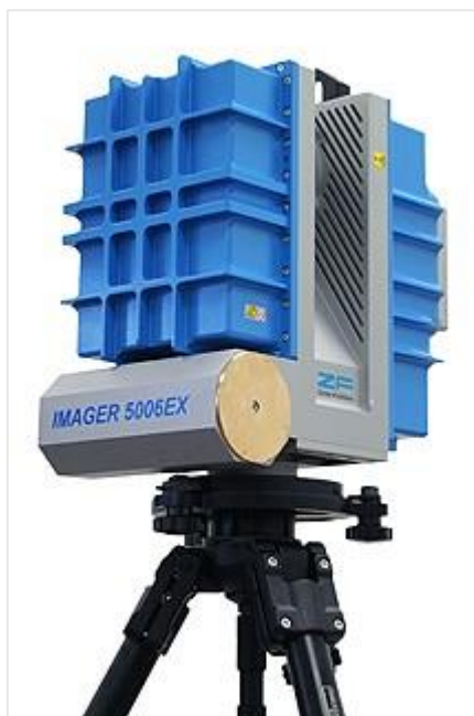
Мал. 3 Сканер Z+F IMAGER 5006

Цим вимогам відповідає лазерний сканер Z+F IMAGER 5006 (Німеччина) у складі з цифровою камерою RolleiMetric і лазерна скануюча система Faro Focus 3D 2 .