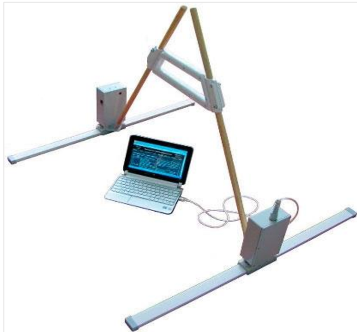
Мал. 1 Георадар «Лоза»

У другій ситуації основна вимога – максимальне освітлення території, яка підлягає огляду і, безумовно, використання засобів, які були перелічені в першій ситуації.