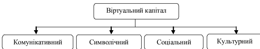
Рис. 3. Критерії оцінки віртуального капіталу

Для оцінки даного критерію П'єром Бурдьє розроблено теорію віртуальних полів, згідно з якою, віртуальне поле – це арена боротьби між акторами (учасниками віртуального співтовариства) в рамках певної практики (віртуальної спільноти) за владу і право привласнювати результати діяльності в межах цього поля (кордонів віртуальної спільноти).