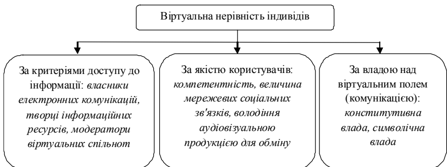
Рис. 2. Віртуальні нерівності у віртуальному просторі

Проте віртуальна нерівність індивідів, що беруть участь у віртуальній спільноті, може бути розподілена за критеріями доступу до інформації відповідно до статусу їх владних повноважень в ієрархіях електронної комунікації [7] (рис. 2). Наприклад, можливо виділити три статусні групи: власники електронних комунікацій (мають право власності), творці інформаційних ресурсів (мають право на участь у створенні інформаційного ресурсу), модератори віртуальних спільнот (мають право управління спільнотою) і користувачі (мають право на участь у діяльності віртуальної спільноти).