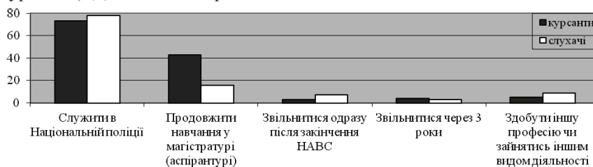
Рис. 2. Плани курсантів та слухачів щодо професійної діяльності після закінчення академії, %

При відповіді на запитання щодо подальших планів після закінчення навчання в академії респонденти обрали такі варіанти: 1) служити в Національній поліції (78 % слухачів; 73 % курсантів); 2) продовжити навчання в магістратурі (аспірантурі) (43 % курсантів; 16 % слухачів); 3) звільнитися одразу після закінчення академії (7 % слухачів; 3 % курсантів); 4) звільнитися через три роки (4 % курсантів, 3 % слухачів); 5) здобути іншу професію чи зайнятися іншим видом діяльності (9 % слухачів; 5 % курсантів). Дані подані на рис. 2.