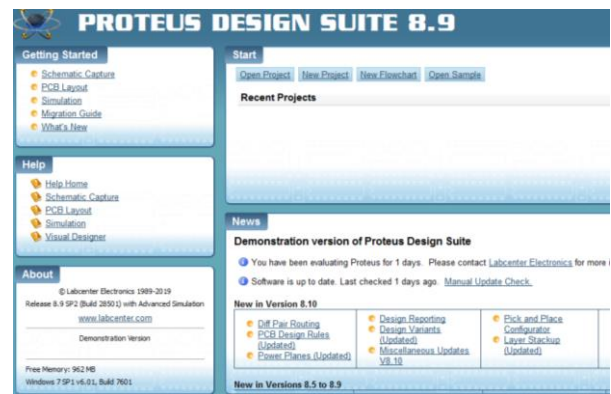
Рис. 1. Стартова сторінка демоверсії Proteus

Є демонстраційна версія яку можна використовувати для навчальних закладів з обмеженням (рис.1): неможливість збереження проекту та його друку; неможливість створення своїх власних схем на основі МК, проте після відкриття існуючих схем є можливість змінити програму, виконувану мікроконтролером, і поспостерігати результат її виконання.