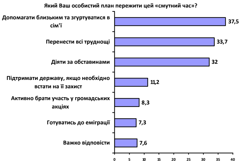
Рис. 1. Процентний розподіл відповідей на запитання Який Ваш особистий план пережити цей «смутий час»? (% до усіх). Сума показників не дорівнює 100 %, тому що респонденти мали можливість обрати декілька варіантів відповідей

Зосередженість на власних проблемах, сімейних справах, егоцентризм простежуються у відповідях щодо того, як себе треба поводити під час кризи. Це стає очевидним із аналізу даних, що наведені на рисунку 1. Ми бачимо, що активну позицію можуть зайняти порівняно невеликі частки населення. Більшість опитаних обирають пасивний шлях, що передбачає тактику «пережити важкі часи, спираючись на близьких людей».