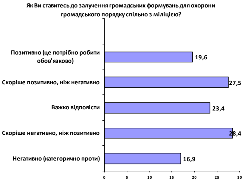
Рис. 3. Процентний розподіл відповідей на питання «Як Ви ставитесь до залучення громадських формувань для охорони громадського порядку спільно з міліцією?» (% до тих, хто відповів)

Певна частка слобожан вважає за доцільне, аби громадяни залучалися до дій міліції з підтримки громадського порядку. Як бачимо з гістограми на рисунку 3, «голоси» pro та contra фактично поділено навпіл.