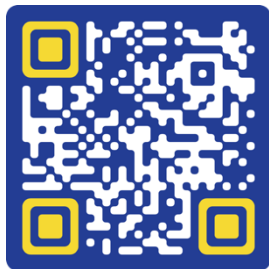
Женевська конвенція (III) про поводження з військовополоненими

Отже, допустимі супутні втрати – ті, що не перевищують конкретної та прямої воєнної переваги.