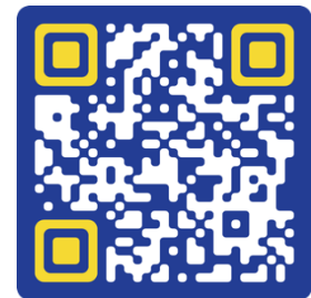
Додатковий протокол (I) до Женевських конвенцій від 12 серпня 1949 року