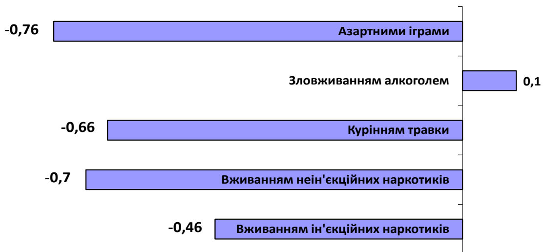
Рис. 1. Індексна оцінка розбіжностей у суб'єктивній оцінці респондентами зв'язку їх перебування у в'язниці з різними видами адиктивної поведінки.

Для виявлення розбіжностей у суб'єктивній оцінці респондентами зв'язку їх перебування у в'язниці з різними видами адиктивної поведінки нами було підраховано сумарні індекси. Значення індексів коливається від 1 до -1. Значення 1 означає, що респондент повністю згоден, що його перебування у в'язниці пов'язано з тим чи іншим видом адиктивної поведінки. Значення індексу -1 означає, що респондент повністю не згоден, що його перебування у в'язниці пов'язано з тим чи іншим видом адиктивної поведінки (рис. 1). З усіх видів адиктивної поведінки, найбільш явний та усвідомлений зв'язок з перебуванням у в'язниці визначається респондентами відносно зловживання алкоголем.