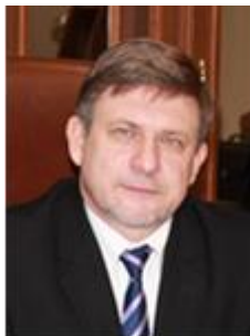
Віктор ЧЕНЦОВ ® доктор наук з державного управління, професор, академік Академії політичних наук України, Української академії наук з державного управління, Заслужений діяч науки і техніки України