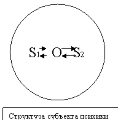
Рис. 1. Схема структуры субъекта психики (S1, S2 – субъекты жизни; O – объект).

информации, оно признается нами психическим. В результате отдельные субъекты жизни либо приходят, либо нет к согласованной жизнедеятельности. Психический субъект – единство субъектов жизни, скрепляемое опосредующим их взаимодействия объектом (см. рис. 1.).